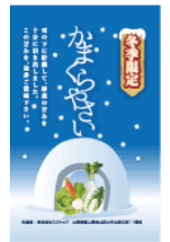
“かまくらやさい” ロゴマーク

“かまくらやさい”とは、野菜を雪の下(かまくら)で貯蔵する雪国ならではのブランド野菜です。